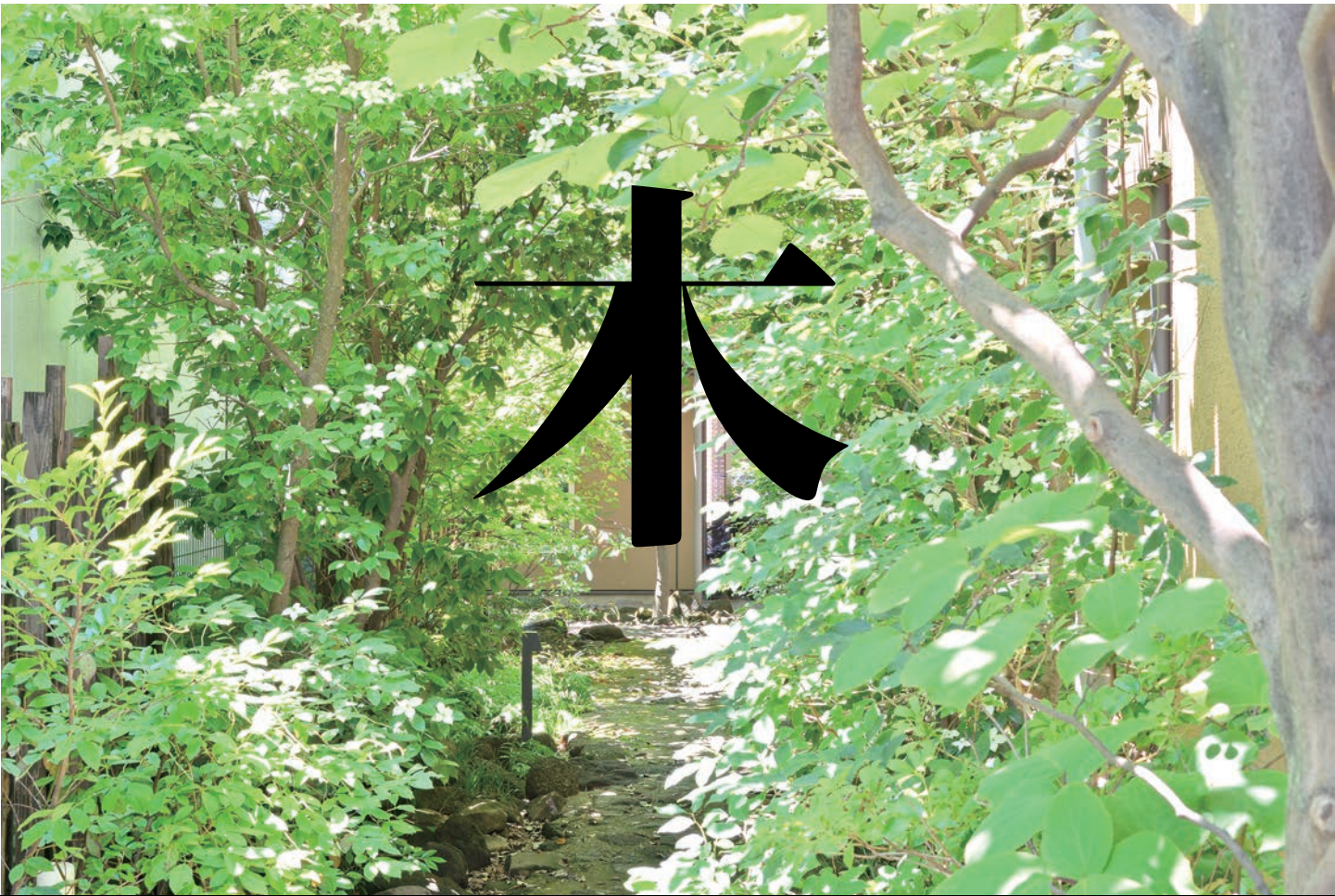
自然な庭、不自然な庭。／ 2018 年／ 東京 立川