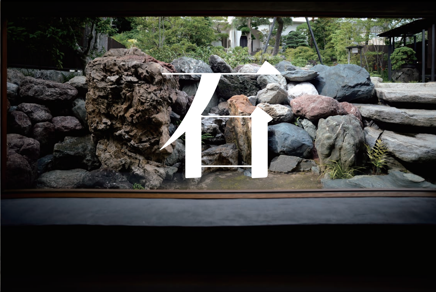
西治プロジェクトの茶庭／ 2024 年／千葉 船橋